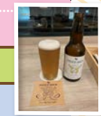
2・3号館前 神大ビール