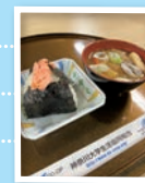
10号館2F おにぎり&豚汁