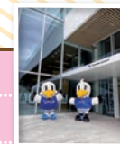
1号館横モニュメント前 記念撮影 JIN&KANA